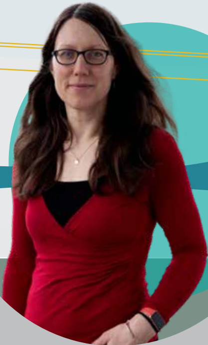
LE SÌLEAS NICLÈOID

Stiùiriche a' Chùrsa Inntigidh, Sabhal Mòr Ostaig