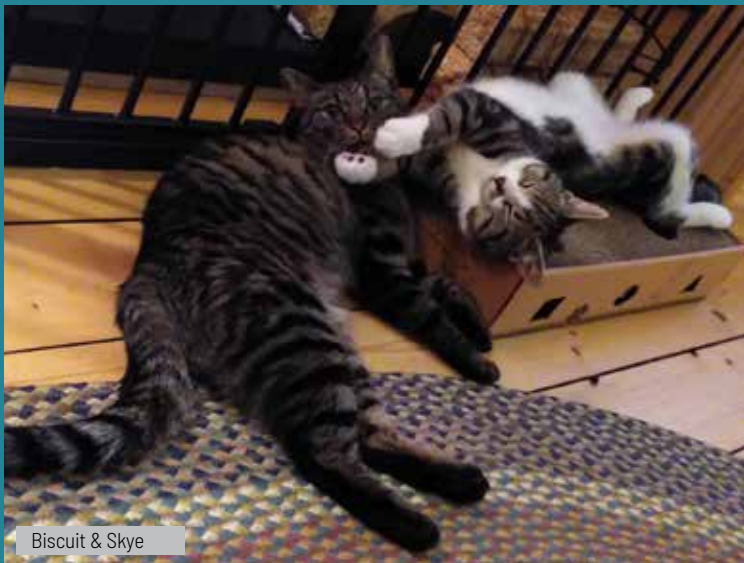
Biscuit &amp; Skye